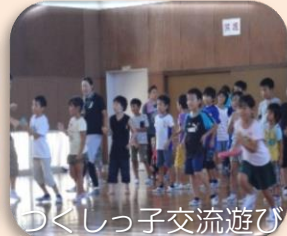
つくしっ子交流遊び