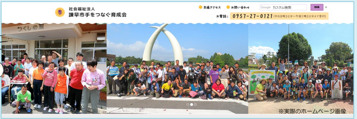
※実際のホームページ画像